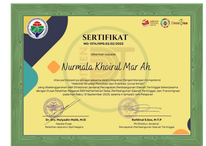
Sertifikat Penulisan dan Publikasi Jurnal Ilmiah dari Kementerian Desa dan PDT Tahun 2023