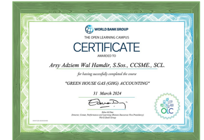
Sertifikat Green House Gas (GHG) Accounting dari The World Bank Group, Tahun 2024