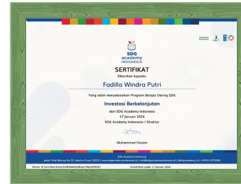
Sertifikat Investasi Berkelanjutan dari SDG Academy, Jakarta Tahun 2024