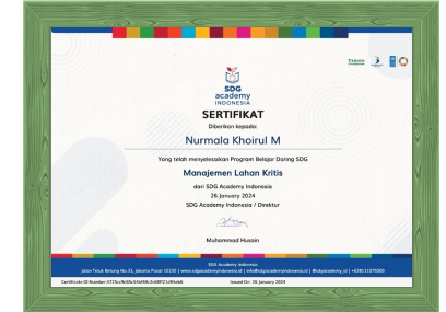
Sertifikat Manajemen Lahan Kritis dari SDG Academy, Jakarta Tahun 2024