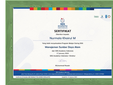
Sertifikat Manajemen Sumber Daya Alam dari SDG Academy, Jakarta Tahun 2024