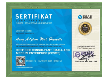
Certified Consultant Small Medium Enterprise (CCSME) dari ESAS Management, Jakarta Tahun 2024