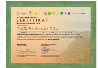
Sertifikat Pelatihan Perhutanan Sosial dari Belantara Foundation dan Pascasarjana Univ. Pakuan tahun 2024