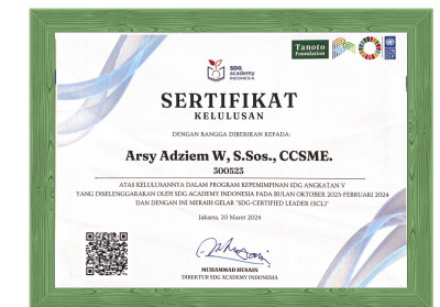
Sertifikat SDGs Certified Leader dari Sustainable Development Goals Academy Tahun 2024