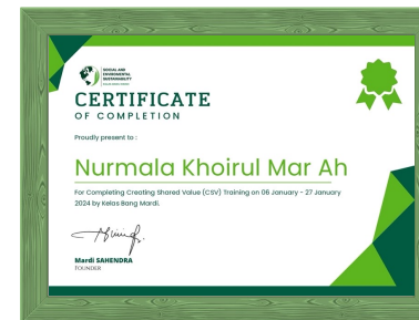
Sertifikat Creating Shared Value (CSV) dari Social and Environmental Sustainability KBM 2024