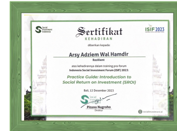
Sertifikat SROI dari Social Investment Indonesia (SII), Bali Tahun 2023