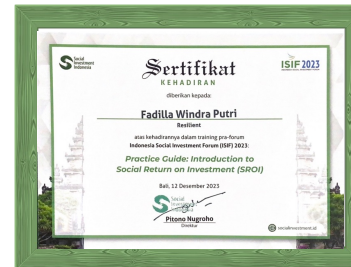
Sertifikat SROI dari Social Investment Indonesia (SII), Bali Tahun 2023