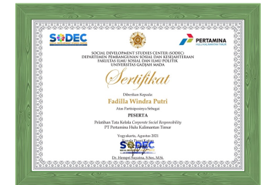
Sertifikat Pelatihan Tata Kelola Corporate Social Responsibility dari SODEC, Yogyakarta Tahun 2021